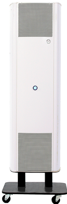
Modello su ruote (-ST)